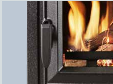
Poignée de porte