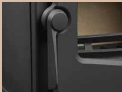
Poignée de porte en fonte